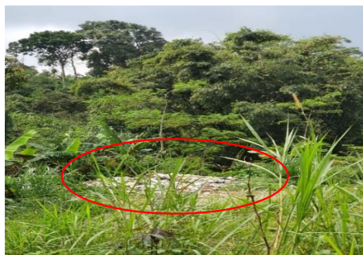
Gambar 2. Tumpukan Sampah pada Salah Satu Ladang Warga

Berdasarkan latar belakang di atas, maka perlu diadakan penyuluhan terlebih dahulu dalam mengenal sampah. Hal ini menjadi jembatan pertama bagi masyarakat dalam fase pengelolaan yaitu membedakan atau memilah antara sampah organik dan sampah anorganik. Selanjutnya, tim pengabdian masyarakat dan perangkat desa sepakat untuk fokus pada pengelolaan sampah organik yang nantinya dijadikan pupuk atau herbal penawar yang lebih dikenal dengan Mikro Organisme Lokal (MOL). MOL adalah suspensi dari hasil fermentasi yang berasal dari sisa-sisa pembusukan yang mudah terurai (A.R. & Anugrah, 2017) dan bisa digunakan untuk penyubur semua jenis tanaman bahkan sebagai herbal penawar pada hewan ternak. Hal ini sangat menguntungkan bagi warga sekitar dikarenakan kebanyakan masyarakat Kejoren berprofesi sebagai petani sayur dan peternak sapi dan kambing. Melihat kondisi pasca covid-19 pada manusia, kini masalah baru ditemukan pada hewan ternak khususnya sapi yang dinamakan PMK (Penyakit Mulut dan Kuku). Sedangkan hasil dari fermentasi MOL ini nanti juga bisa digunakan dalam mengatasi masalah PMK dengan cara menggosokkan pada gigi atau mulut sapi dan juga kuku sapi.