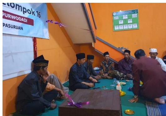
Gambar 4. Sosialisasi pemilahan sampah bersama masyarakat Dusun Kejoren

Sosialisasi terhadap masyarakat terus berlangsung sebagai tahap meningkatkan asumsi kepada masyarakat bahwa program yang akan ditawarkan ini akan berdampak baik bagi seluruh warga. Semua proses sosialisasi terus digalakkan baik dengan masyarakat umum maupun beberapa organisasi masyarakat yang ada di Dusun Kejoren, Desa Gerbo.