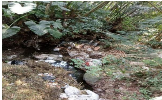
Gambar 1. Tumpukan Sampah pada Aliran Sungai

Maka dari itulah pengabdian ini dilakukan dalam rangka mengawali program penanganan masalah sampah khususnya sampah basah mulai dari awal hingga menjadi sampah resik yang dimanfaatkan semaksimal mungkin. Tentunya hal ini tidak lepas dari adanya dukungan yang sangat baik dari masyarakat sekitar untuk mewujudkannya. Membangun pemahaman masyarakat tentang kesadaran menjaga lingkungan bersih sangat diperlukan dalam proses pengelolaan sampah menjadi sesuatu yang bermanfaat (Surya & Noor, 2020).