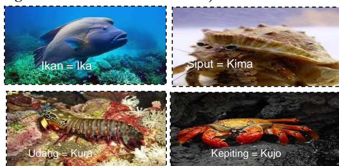
Gambar 1.

Laut dan binatang laut bagi masyarakat Lamaholot di Waibalun memiliki simbol dan makna tertentu yang mengajarkan masyarakat tentang kearifan hidup. Binatang laut merupakan biota laut yang menjaga keharmonisan ekologi laut. Binatang laut menurut kebiasaan masyarakat harus dijaga, dihargai, dilindungi. Binatang laut yang menjadi tokoh cerita diambil dari binatang yang menjadi kekuatan, yakni ikan, siput, udang, dan kepiting. Binatang laut tersebut memiliki keunikan, karakter, dan simbol kearifan bagi masyarakat Lamaholot di Waibalun. Ikan= ika dalam budaya Lamaholot sebagai binatang laut yang memiliki kekuatan simbol kemakmuran dengan karakter lincah, gesit, selalu dalam persatuan kawanannya, simbol kemakmuran, dan kesejahteraan. Siput= kima simbol kemenangan, dengan karakternya sebagai binatang mandiri, sederhana, selalu berjuang. Udang= kura simbol ketulusan, kesabaran, kerendahan hati, dan kecerdasan. Kepiting= kujo sebagai simbol keuletan, memiliki daya tahan yang kuat, dan keberanian.