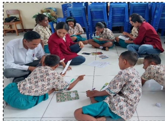
Gambar 3. pendampingan pengeditan naskah cerita fabel

Dalam kegiatan pendampingan ini ditemukan minat, semangat, kreativitas, pengetahuan, dan pengalaman menulis cerita fabel pada para siswa kelas VII dalam menulis cerita fabel menggunakan media gambar. Setelah siswa menyimak materi yang disampaikan pendamping, siswa antusias untuk mengikuti petunjuk bimbingan yang diberikan. Kegiatan awal, siswa mengamati, memperhatikan contoh. Kemudian termotivasi menulis cerita fabel berbasis budaya Lamaholot dengan media gambar sesuai langkah-langkah yang ada berkaitan dengan latar, alur, tokoh, dan karakter dengan menggunakan bahasa yang tepat.