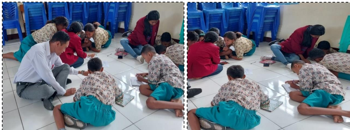
Gambar 2. pendampingan penulisan naskah cerita fabel