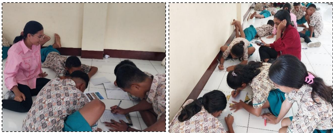
Gambar 1. pendampingan penulisan naskah cerita fabel