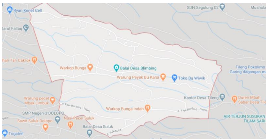
Gambar 1. Peta Wilayah Desa Blimbing

Penggalan aset ini dilakukan melalui beberapa cara, yaitu: pemetaan wilayah, pemetaan komunitas, dan pemetaan aset. Untuk pemetaan wilayah tim pengabdian melakukan penelusuran zona wilayah tentang berbagai macam vegetasi alam, penggunaan lahan, jenis tanah, macam-macam tanaman, kepemilikan lahan, dan lain sebagainya. Penelusuran wilayah dilakukan bersamaan dengan pemetaan komunitas dengan melakukan sowan ke rumah Bapak Kepala Dusun. Sedangkan untuk penelusuran wilayah, tim berkunjung ke Balai Desa dan memperoleh peta Desa Blimbing yang di dalamnya terdapat tiga dusun, yakni Dusun Krajan, Dusun Duren, dan Dusun Pakisaji.