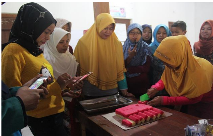
Gambar 5. Pelatihan pembuatan Kue Si Engkong

Dengan adanya pemanfaatan singkong menjadi kue, warga mulai dapat mengetahui bahwa singkong dapat dijadikan kue yang memiliki nilai ekonomis yang lebih tinggi, sehingga tidak hanya dijual mentahan. Warga sangat antusias untuk dapat terbimbing belajar membuat kue dari bahan singkong karna dapat membantu perekonomian keluarga. Dampak dari pelatihan kue Si Engkong yang telah dilaksanakan adalah memberikan inovasi baru hasil bumi yang ada di Dusun Krajan Desa Blimbing dan juga ada pemasukan tambahan bagi masyarakat. Selain itu juga melatih masyarakat agar lebih kreatif dalam memanfaatkan hasil bumi yang ada, menciptakan lapangan pekerjaan bagi warga yang belum memiliki pekerjaan tetap dan pekerjaan sampingan yang sudah memiliki pekerjaan tetap (Oktaviani dkk. 2019, 20–22).