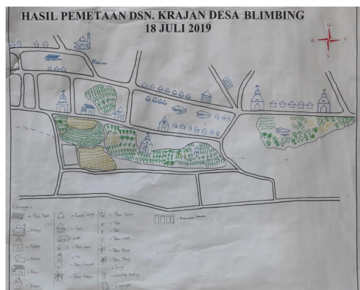
Gambar 2. Hasil Pemetaan Dusun Krajan

Community mapping adalah pendekatan atau cara untuk memperluas akses ke pengetahuan lokal. Community mapping merupakan visualisasi pengetahuan dan persepsi berbasis masyarakat yang mendorong pertukaran informasi dan menyetarakan kesempatan bagi semua anggota untuk berpartisipasi dalam proses yang mempengaruhi lingkungan dan kehidupan mereka. Hasil community mapping yang dilakukan oleh tim pengabdian adalah sebagai berikut: