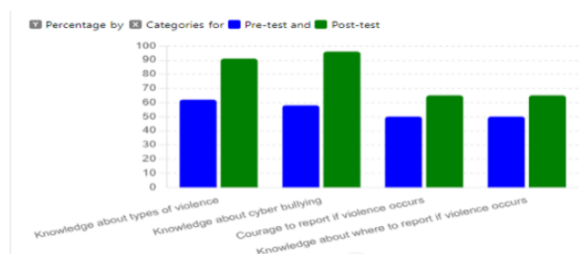
Gambar 5. Peningkatan pengetahuan peserta

Berdasarkan gambar di atas, hasil survei mengidentifikasi beberapa hambatan utama yang dihadapi peserta dalam melaporkan kasus kekerasan. Hambatan terbesar adalah ketakutan untuk melapor yang dialami oleh 34,8% peserta. Ketakutan ini menunjukkan bahwa banyak peserta khawatir akan dampak sosial atau konsekuensi negatif yang mungkin mereka hadapi setelah melapor, seperti stigma atau diskriminasi dari lingkungan sekitar. Hambatan lainnya adalah ancaman dari pelaku yang dialami oleh 30,4% peserta. Ancaman ini semakin memperkuat alasan para korban untuk tidak melaporkan kekerasan yang mereka alami, karena adanya intimidasi dari pelaku yang berpotensi membahayakan mereka. Selain itu, 26,1% peserta mengaku tidak menyadari bahwa tindakan tertentu yang mungkin dianggap “biasa” atau normal sebenarnya merupakan bentuk kekerasan seksual. Hal ini mengindikasikan adanya kesenjangan dalam pemahaman mengenai apa saja yang termasuk dalam kategori kekerasan seksual, sehingga sebagian korban tidak menyadari bahwa mereka telah menjadi korban kekerasan. Sementara itu, 8,7% peserta lainnya tidak tahu harus melapor ke mana, yang menunjukkan perlunya edukasi lebih lanjut mengenai jalur pelaporan serta akses ke layanan yang aman.