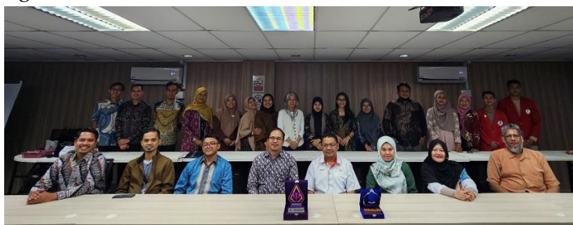
Gambar 1. Penandatanganan perjanjian kerja sama dan diskusi Program PkM: UT-UMS-CLC-FGV

Pada tahap awal persiapan program, tim PkM memilih CLC FGV Sahabat di Lahad Datu, Sabah, Malaysia, sebagai lokasi utama karena tingginya risiko kekerasan terhadap anak dan perempuan serta keterbatasan akses pendidikan di komunitas pekerja migran. Universiti Malaysia Sabah (UMS), CLC FGV Sahabat, dan FGV Holding Berhad Malaysia dipilih sebagai mitra utama untuk mendukung keberlanjutan program ini. Selanjutnya, dilakukan analisis kebutuhan bersama mitra melalui diskusi dan wawancara mendalam. Pertemuan inisiasi kerja sama antara tim PkM dengan UMS, CLC FGV Sahabat, dan FGV Holding Berhad menegaskan komitmen bersama dalam mengidentifikasi tantangan utama yang dihadapi komunitas, khususnya terkait kekerasan. Analisis ini menjadi dasar perancangan materi pelatihan dan fasilitas pendukung yang sesuai dengan kebutuhan masyarakat. Kerja sama formal pertama dilakukan dengan Universiti Malaysia Sabah (UMS) pada 18 Agustus 2023. Universiti Malaysia Sabah dipilih sebagai mitra kolaborasi strategis karena kehadirannya sebagai institusi pendidikan lokal yang memiliki pemahaman mendalam tentang kondisi sosial di Sabah.