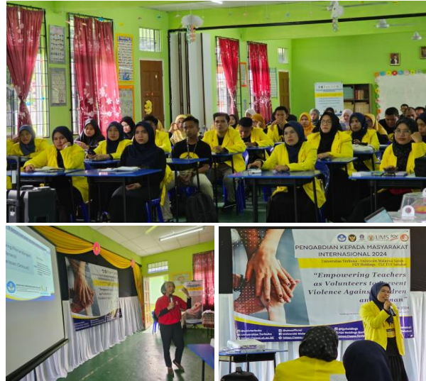
Gambar 2. Peserta PkM yang merupakan guru-guru di CLC FGV Sahabat

mengikuti seluruh rangkaian kegiatan sepanjang hari tersebut. Keberagaman peserta ini memperkaya dinamika diskusi dan pemahaman terhadap materi, karena setiap individu membawa perspektif yang berbeda sesuai dengan pengalaman hidup dan budaya masing-masing.