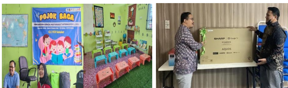
Gambar 3. Penyediaan fasilitas edukasi (a) pojok baca (b) TV

Selain pelatihan, tim PkM juga menyediakan berbagai media dan fasilitas pembelajaran, yaitu TV, buku, dan perlengkapan perpustakaan untuk mendukung pemahaman lebih lanjut. Pojok Baca didirikan di CLC FGV Sahabat, dilengkapi dengan buku bacaan dan perlengkapan perpustakaan. Fasilitas ini berfungsi untuk mendukung perkembangan literasi anak serta memberikan informasi tentang pencegahan kekerasan.