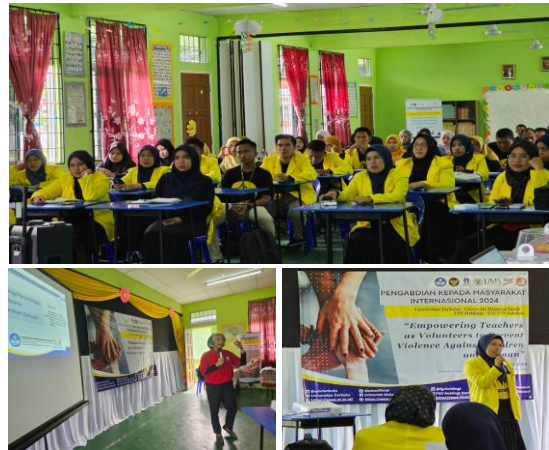
Gambar 2. Peserta PkM yang merupakan guru-guru di CLC FGV Sahabat

utama program. Para guru ini memiliki latar belakang yang beragam, mencakup variasi tingkat pendidikan, etnisitas, kebangsaan, agama, serta kondisi sosial ekonomi. Meski demikian, peserta menunjukkan semangat dan antusiasme yang tinggi dalam mengikuti seluruh rangkaian kegiatan sepanjang hari tersebut. Keberagaman peserta ini memperkaya dinamika diskusi dan pemahaman terhadap materi, karena setiap individu membawa perspektif yang berbeda sesuai dengan pengalaman hidup dan budaya masing-masing.