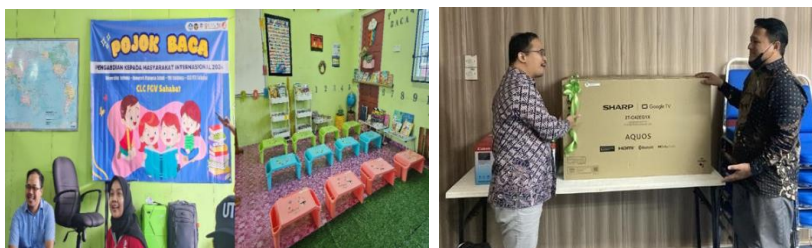
Gambar 3. Penyediaan fasilitas edukasi (a) pojok baca (b) TV

Selain pelatihan, tim PkM juga menyediakan berbagai media dan fasilitas pembelajaran, yaitu TV, buku, dan perlengkapan perpustakaan untuk mendukung pemahaman lebih lanjut. Pojok Baca didirikan di CLC FGV Sahabat, dilengkapi dengan buku bacaan dan perlengkapan perpustakaan. Fasilitas ini berfungsi untuk mendukung perkembangan literasi anak serta memberikan informasi tentang pencegahan kekerasan.