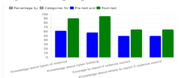
Gambar 5. Peningkatan pengetahuan peserta

Berdasarkan gambar di atas, hasil survei mengidentifikasi beberapa hambatan utama yang dihadapi peserta dalam melaporkan kasus kekerasan. Hambatan terbesar adalah ketakutan untuk melapor yang dialami oleh 34,8% peserta. Ketakutan ini menunjukkan bahwa banyak peserta khawatir akan dampak sosial atau konsekuensi negatif yang mungkin mereka hadapi setelah melapor, seperti stigma atau diskriminasi dari lingkungan sekitar. Hambatan lainnya adalah ancaman dari pelaku yang dialami oleh 30,4% peserta. Ancaman ini semakin memperkuat alasan para korban untuk tidak melaporkan kekerasan yang mereka alami, karena adanya intimidasi dari pelaku yang berpotensi membahayakan mereka. Selain itu, 26,1% peserta mengaku tidak menyadari bahwa tindakan tertentu yang mungkin dianggap “biasa” atau normal sebenarnya merupakan bentuk kekerasan seksual. Hal ini mengindikasikan adanya kesenjangan dalam pemahaman mengenai apa saja yang termasuk dalam kategori kekerasan seksual, sehingga sebagian korban tidak menyadari bahwa mereka telah menjadi korban kekerasan. Sementara itu, 8,7% peserta lainnya tidak tahu harus melapor ke mana, yang menunjukkan perlunya edukasi lebih lanjut mengenai jalur pelaporan serta akses ke layanan yang aman.