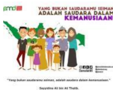
Gambar 5. Gagasan media online

Imam At-Thobari menjelaskan bahwa dengan kasih sayang Allah SWT terhadap nabi dan umatnya, nabi berdakwah dengan kasih sayang dan memberikan kemudahan. Bahkan ketika nabi dihina dan dicaci oleh kaumnya, beliau justru mendoakan mereka dengan doa Ya Allah, berikanlah hidayah kepada kaumku, karena mereka tidak tahu . Gambar di bawah ini merupakan contoh gagasan di media online yang bersifat memberikan solusi atas segenap permasalahan