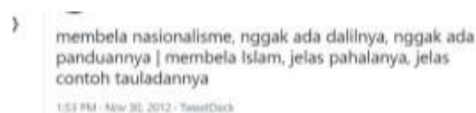
Gambar 2. unggahan FS

Sebagai contoh seorang muallaf bernama FS mengunggah di dalam twitter, bahwa membela nasionalisme, nggak ada dalilnya, nggak ada panduannya . Padahal dalam membela Islam, jelas pahalanya, dan juga jelas contoh tauladannya. Sebagaimana gambar di bawah ini