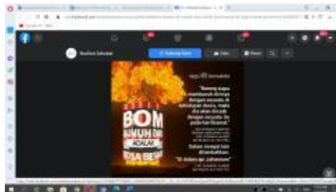
Gambar 1. contoh jihad di media online

Gambar di bawah ini merupakan salah satu contoh jihad di media online .