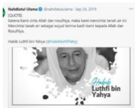
Gambar 3. tweet Nahdlatul Ulama

Pernyataan FS di atas ditandingi dengan pernyataan dari tweet Nahdlatul Ulama yang mengutip pernyataan HL: Karena kami cinta Allah dan RasulNya, maka kami mencintai tanah air ini. Mencintai tanah air sebagai wujud terima kasih kami kepada Allah dan RasulNya (Habib Luthfi, 2019). Sebagaimana gambar di bawah ini