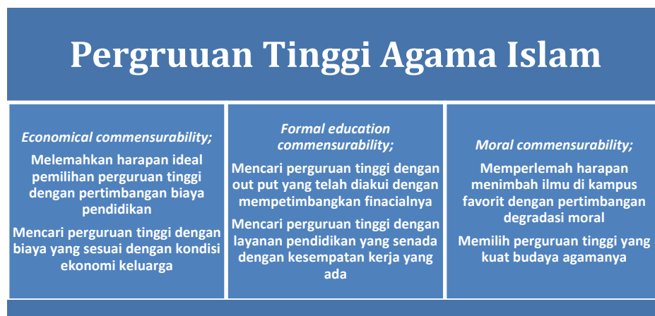
Gambar 3. Nalar Pasca Krisis Atensi Pemilihan Perguruan Tinggi Islam

Sebagaimana dikemukakan bahwa juga ada tiga krisis yang dihadapi oleh calon mahasiswa dalam memilih perguruan tinggi, yakni economical incommensurability , formal education incommensurability dan moral incommensurability . Ketiganya tentu memiliki hubungan dengan prinsip executive atensinya. Dengan kata lain, beberapa solusi pemecah krisis merupakan proses penciptaan kesesuaian dari harapan dan kondisi yang terjadi. Dalam hal ini penulis menyebut paradigma atensinya sebagai attention commensurability (kesesuaian perhatian). Sebab commensurability merupakan lawan incommensurability , maka beberapa prinsip paradigma yang dikembangkan adalah sebagaimana gambar dibawah ini: