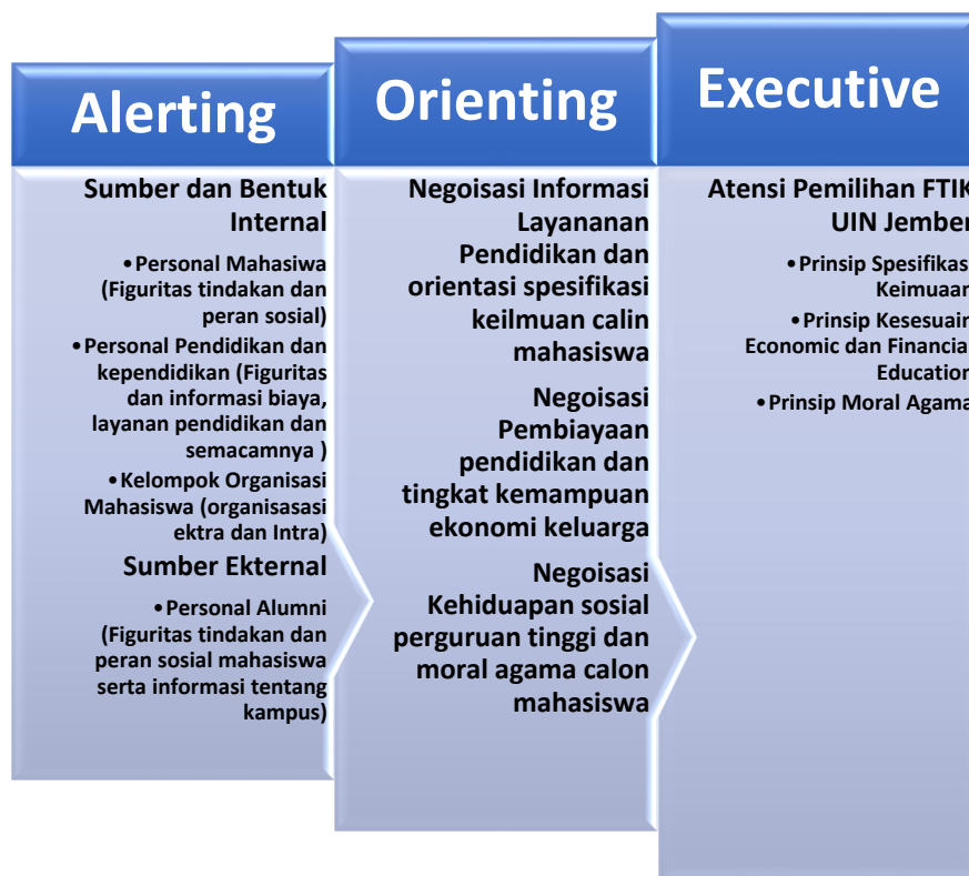
Gambar 1. Framework Atensi Colan Mahasiswa

Sedangkan, executive atensi adalah mencakup kemampuan untuk menyelesaikan konflik atas tanggapan yang muncul. Kontrol eksekutif juga mencakup proses yang mengontrol atensi termasuk memonitor kesalahan dan kontrol terhadap gangguan. Struktur anatomi otak yang berperan dalam executive function yaitu area cingulatus anterior dan korteks prefrontal lateral dengan neurotransmitter dopamin yang berperan dalam modulasi aktivitas saraf area tersebut (Michael I. Posner & Rothbart, 2007). Penjelasan ini yang dalam sudut pandang sosiologis sebagai proses penetapan tindakan yang seirama dengan hasil negosiasi pertemuan stimulus informasi dan harapan fundamental calon mahasiswa baru FTIK UIN Jember. Untuk itu, proses executive atensi sebenarnya sangat sederhana untuk dijelaskan. Paparan dan analisa akan mempersoalkan hasil dialetika harapan dan stimulus yang terjadi. Sehingga beberapa penjelasan terkait hal ini tidak dapat dipisahkan dari dua sub pembahasan di atas. Namun dalam proses executive atensi, akan lebih memfokuskan pada tandensi yang dipilih dan dijaga sebagai sebuah keputusan perhatian dalam implemetasi pemilihan FTIK UIN Jember sebagai tempat pendidikan tinggi. Untuk memahami rinci konsep yang dibangun adalah sebagaimana dibawah ini: