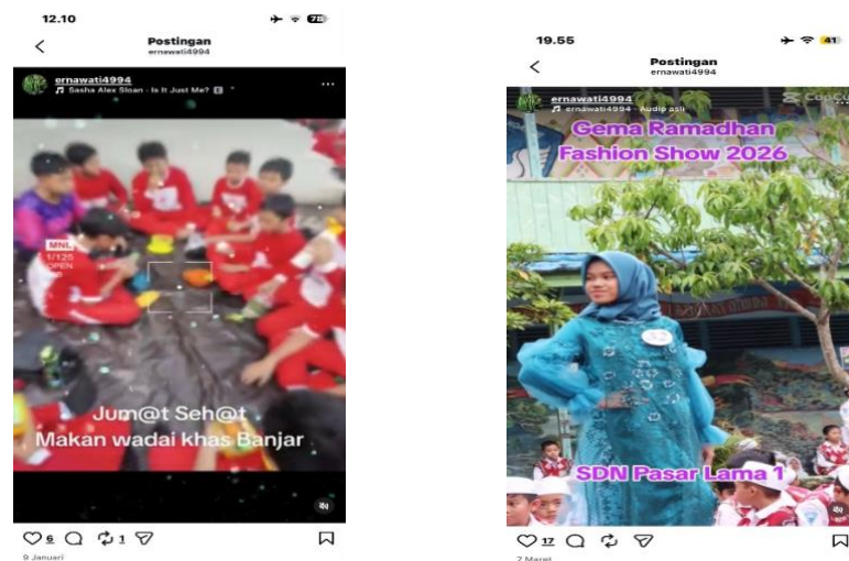
Gambar 2. Program Pembiasaan Karakter

Hasil wawancara juga menunjukkan bahwa orang tua menilai program pembiasaan tersebut memberikan dampak positif terhadap perkembangan sikap dan perilaku murid dalam kehidupan sehari-hari. Pembiasaan yang dilakukan secara konsisten di sekolah turut membantu membentuk karakter murid menjadi lebih disiplin, bertanggung jawab, dan mandiri. Dokumentasi pelaksanaan program pembiasaan karakter di SDN Pasar Lama 1 Banjarmasin disajikan pada Gambar 1.