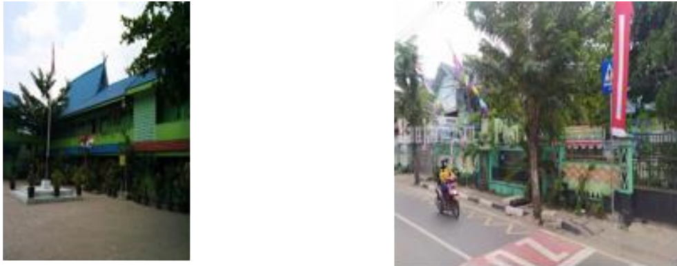
Gambar 1. Profil SDN Pasar Lama 1 Banjarmasin

Visi SDN Pasar Lama 1 Banjarmasin adalah: