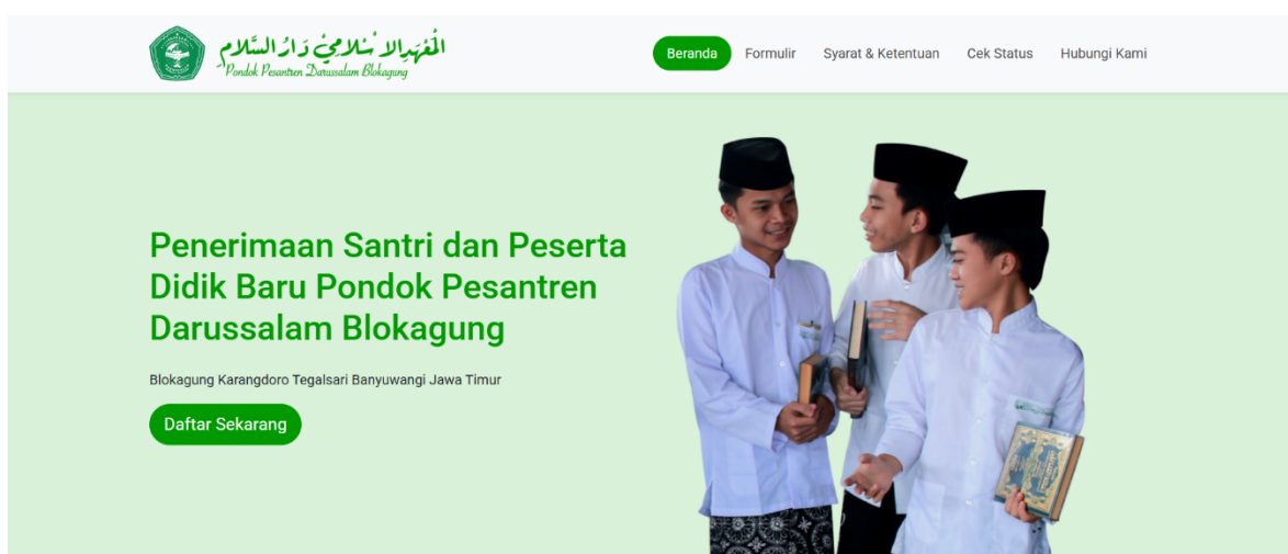
Gambar.4 Laman Tampilan Penerimaan Santri dan Peserta Didik Baru

Selain pendidikan formal, Pondok Pesantren Darussalam Blokagung Banyuwangi juga memperkuat pendidikan nonformal melalui Madrasah Diniyah Takmiliah Al Amiriyah tingkat Ula, Wustha, dan Ulya sebagai basis penguatan karakter, spiritualitas, dan pendalaman ilmu keislaman santri. Keberadaan pendidikan diniyah ini menjadi bukti bahwa transformasi pendidikan di lingkungan pesantren tidak menghilangkan identitas tradisi keilmuan Islam klasik, melainkan mengintegrasikannya dengan kebutuhan pendidikan era digital. Dengan demikian, kepemimpinan transformatif di pesantren mampu menciptakan ekosistem pendidikan Society 5.0 yang humanis, religius, inovatif, dan berorientasi pada pengembangan sumber daya manusia unggul.