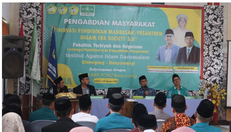
Gambar.3 Kepemimpinan Transformatif dalam Pengembangan Ekosistem Pendidikan Society 5.0

Hasil penelitian menunjukkan bahwa kepemimpinan transformatif menjadi faktor utama dalam membangun ekosistem pendidikan adaptif di lingkungan pesantren. Model kepemimpinan tersebut mampu menciptakan sinergi antara nilai religius, kemajuan teknologi, dan inovasi manajemen pendidikan sehingga pesantren tetap memiliki daya saing serta relevansi tinggi dalam menghadapi tantangan pendidikan era Society 5.0.