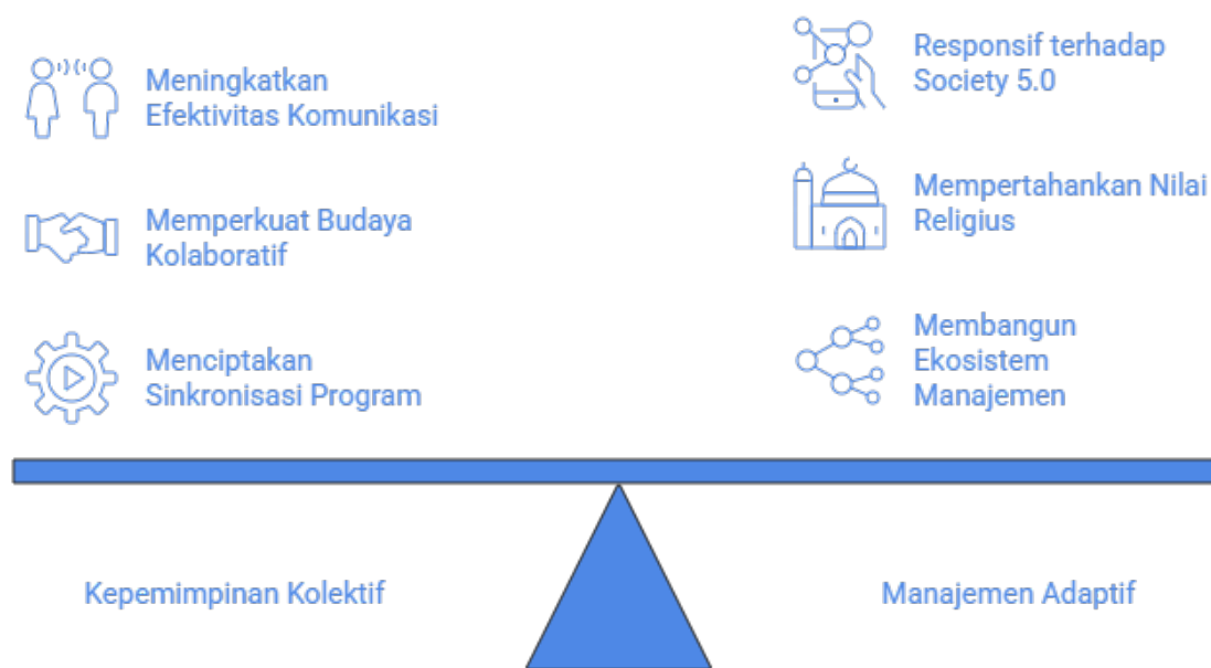
Gambar.1 Orkestrasi Kepemimpinan Kolektif dalam Tata Kelola Pendidikan Pesantren

Temuan penelitian menunjukkan bahwa pola kepemimpinan kolektif mampu meningkatkan efektivitas komunikasi organisasi, memperkuat budaya kolaboratif, dan menciptakan sinkronisasi program antar lembaga pendidikan di lingkungan pesantren. Model tersebut menjadi salah satu faktor penting dalam membangun ekosistem manajemen adaptif yang tetap mempertahankan nilai religius sekaligus responsif terhadap perkembangan Society 5.0.